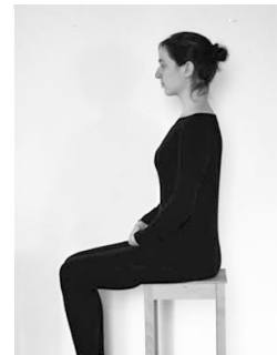
Sitzen auf Stuhl