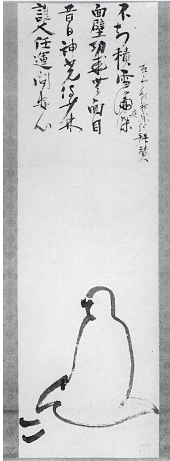
Bodhidharma, 15. Jh. Bokkei Saiyo